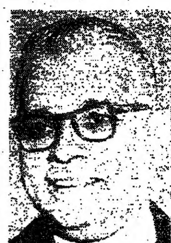
المرحوم السيد محمد اكرم الله والد حضرة صاحب السور المكي الاميرة «نورة» خطيبة سمو الامير حسن ولي العهد المقيم. وقد كان المرحوم اول وزير لخارجية باكستان كما كان سفيرا لباكستان في لندن وباريس وواشنطن.

دلائل مشجعة على وجود النفط بالحجر الصينيه - ذكر المهندس عمر عبد الله نائب رئيس مشروع لوجود البترول في المنطقة التي يحيط بالبحر الاحمر في منطقة الحجر وما جاورها حتى بلدة الحسا، لافراض التنبؤ عن البترول.